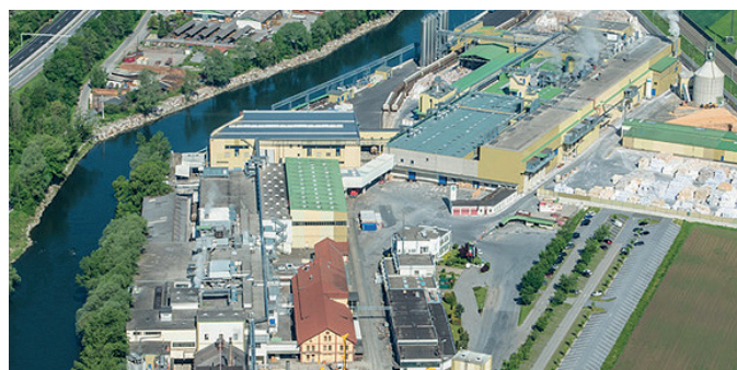
Recycling bei Mayr Melnhof Karton in Frohnleiten, Steiermark

Die gemeinsame Sammlung von Getränkekartons und Kunststoffverpackungen in ganz Österreich hat sich bewährt. Durch das Recycling der Getränkekartonfasern ist ein ressourcenschonender Einsatz des Rohstoffs Holz in der Kartonfabrik gewährleistet. Und: Jedes Kilogramm an Getränkekartons, das recycelt wird, spart ein Kilogramm CO 2 . Das entspricht in Österreich einer Einsparung von nahezu 7.500 Tonnen CO 2 pro Jahr.